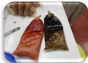
トマトジュース・コーヒー